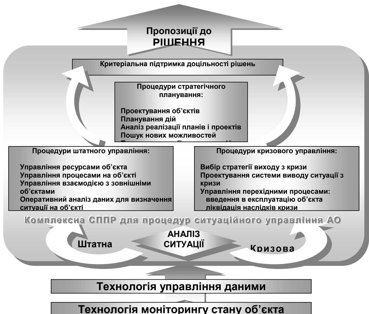
Рис. 3. Комплексна СППР для процедур ситуаційного управління АО